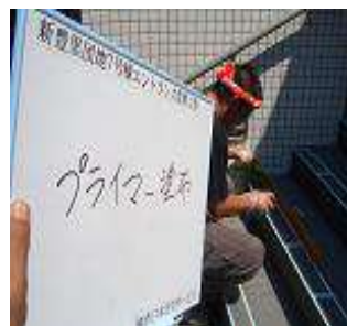
③専用プライマー塗布