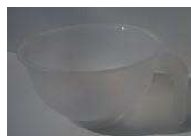
④Σ03主剤、硬化剤混合容器