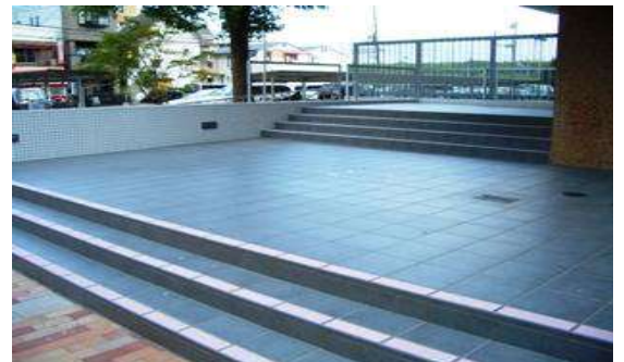
段鼻施工・厚さ 2mm 骨材色 HP-02