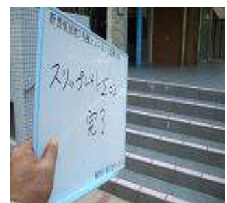
⑩小口の補強、乾燥完了