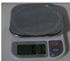
①秤 0.1g単位 3kg用