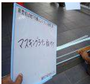
②マスキングライン貼付